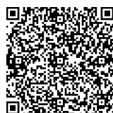
Статистика налоговой службы

Статистика налоговой службы показывает, что с каждым годом регистрируется все больше компаний, которые относятся к малому или среднему бизнесу. Например, на конец 2022 года в России зарегистрировано 6 млн компаний, относящихся к малому, среднему бизнесу и ИП. Последних, кстати, больше половины — 3,7 млн.