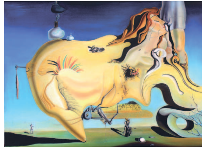
Сальвадор Дали. «Великий Мастурбатор», 1929 г. Центр искусств королевы Софии, Мадрид.

коллективных травм, а также личного бессознательного, Эроса и Танатоса, о которых писал Зигмунд Фрейд. Благодаря психоаналитическим прочтениям произведений искусства, через работы не только Фрейда, но и Карла Густава Юнга, Иероним вновь приобрел актуальность. Классические искусствоведы XX столетия не могли обойти вниманием столь значимую фигуру: появились достаточно глубокие исследования, анализирующие Босха в контексте искусства Средневекового и Возрождения, к ним относятся рассуждения Эрвина Панофски, книги Вильгельма Френгера. Однако реконструкция смыслов картин Иеронима нуждалась в тщательном и долгом исследовании, в кропотливом и методичном труде, что стало делом будущих поколений исследователей, которыми стали Шарль де Тольнай и Людвиг фон Балдас, они приоткрыли завесу непонимания работ художника. Нидерландский учёный Дирк Бакс, изучавший визуальный язык Босха в середине