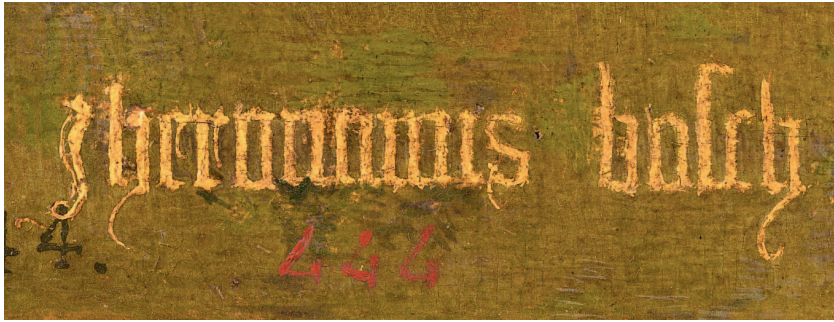
Автограф Иеронима Босха