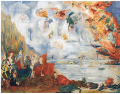
Джеймс Энсор. «Искушения святого Антония», 1909 г.