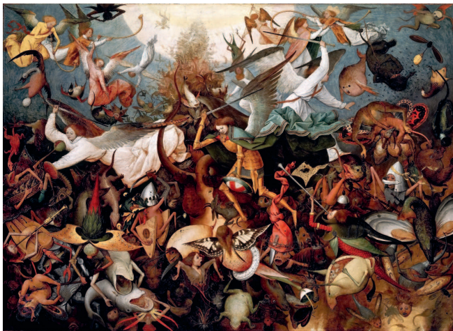
Питер Брейгель Старший. «Падение мятежных ангелов», 1562 г. Королевские музеи изящных искусств, Брюссель

Каждое столетие на свой лад и манер осовременивает Иеронима Босха. Его прискорбный апокалиптизм и повальный эсхатологизм отозвался и в зрителе XX–XXI веков. Заново увиденный сюрреалистами в XX веке — Босх стал зеркалом ужасов Первой и Второй мировых войн. Сальвадор Дали ощутил и увидел в нём предвестника осмысления опыта и последствий