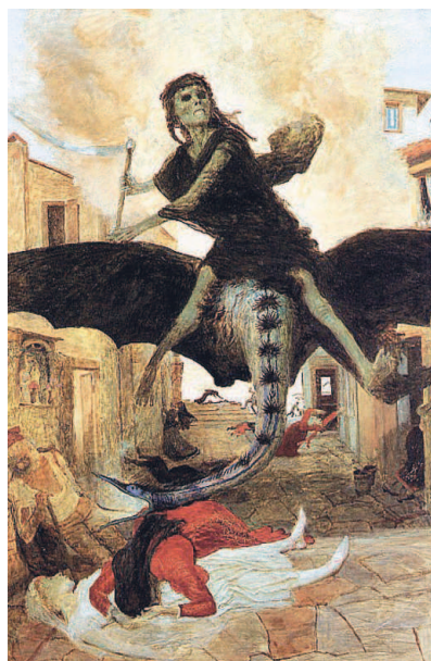
Арнольд Бёклин. «Чума», 1898 г. Базельский художественный музей, Базель.