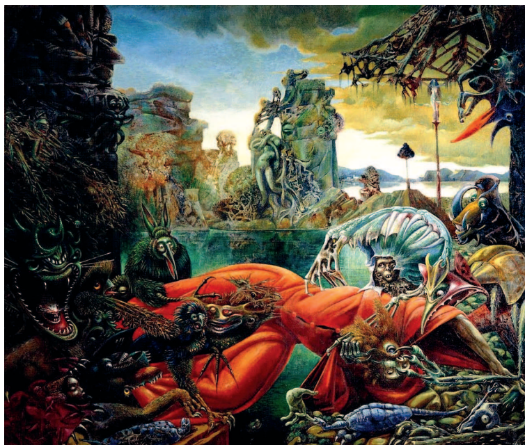
Макс Эрнст. «Искушение святого Антония», 1945 г. Музей Вильгельма Лембрука, Дуйсбург.

Не популярностью ли Босха при испанском дворе навеяны странные и страшные образы Франсиско Гойи? Обращение к Средневековью у художников-