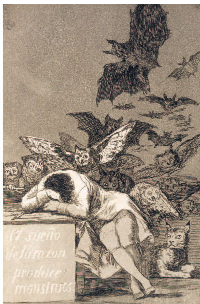
Франсиско Гойя. «Сон разума рождает чудовищ». 1797–1799 гг. Национальная библиотека Испании, Мадрид.