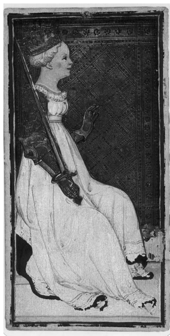
РИС. 2. «Таро Висконти — Сфорца». ДАМА МЕЧЕЙ

Жрица, Императрица, Отшельник... Именно эти изображения, по мнению тарологов, особенно насыщены разнообразной религиозной и оккультной символикой — древнеегипетской, восточной, христианской. Относительно Старших Арканов мнения разделяются — кто-то утверждает, что именно эти карты (не все, но многие) являются древнейшей частью колоды Таро, основа которой была заложена еще в Древнем Египте. Некоторые исследователи, напротив, уверены, что более древней частью являются