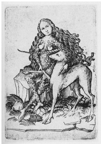
Рис. 1. Немецкая игральная карта XV в.

Прочно обосновавшись в Италии, Испании и Португалии, игральные карты затем пришли в Германию и Францию. Именно во Франции сложилась колода с более привычными нам мастями: красными (бубны, черви) и черными (трефы, пики). Мечи постепенно трансформировались в пики, Кубки — в черви, Палицы — в трефы, а Монеты — в бубны... В каждой масти имеются Туз, Король, Дама, Валет и числовые карты: от «2» до «10». Видимо, существовали также карты без обозначения мастей (рис. 1).