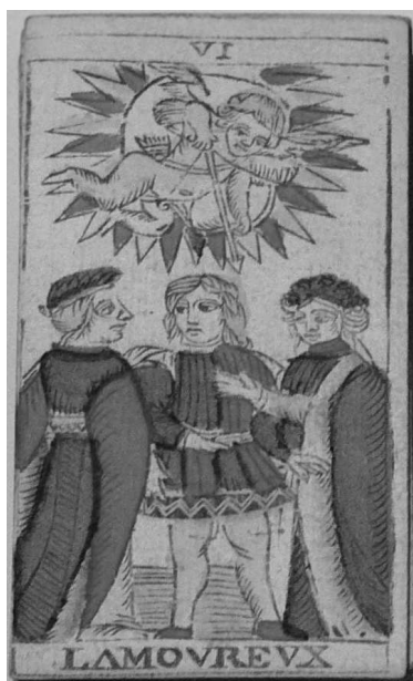
Рис. 3. «Марсельское Таро». Карта Влюбленные. Середина XVIII в.

карты с достаточно примитивными, но в то же время динамичными и яркими изображениями (рис. 3). По версии многих исследователей, автором ее является итальянский гуманист, философ и астролог XV столетия Марсилио Фичино (1433–1499). Если он действительно является автором «марсельских» карт, то получается, что эта колода ненамного моложе «Таро Висконти — Сфорца». Но если она родилась в Италии, то почему ее называли «марсельской»?