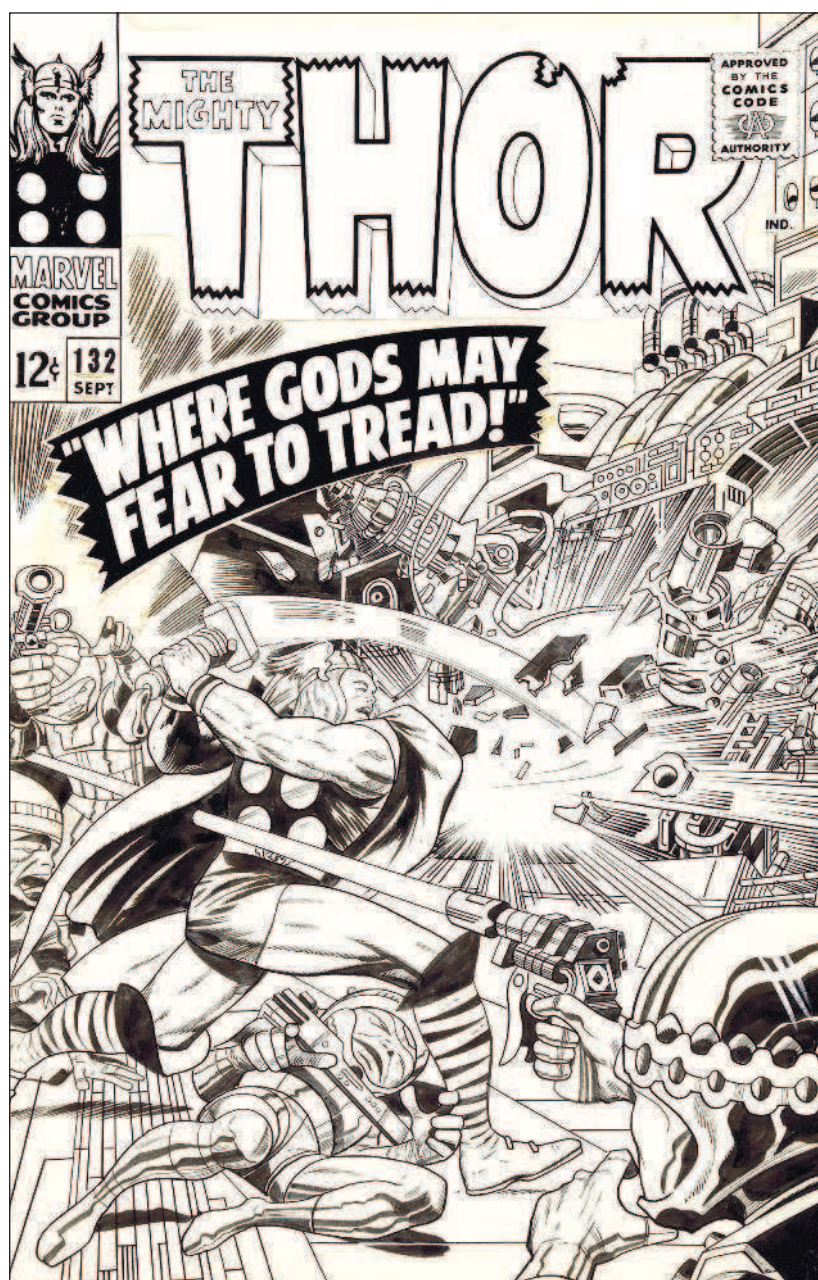
Оригинальная обложка комикса «Тор» № 132 «Колонизатор Ригеля» работы художника Джека Кирби и контуровщика Винса Колетты

Мы умеем наслаждаться чтением комиксов, давайте же научимся создавать их сами!